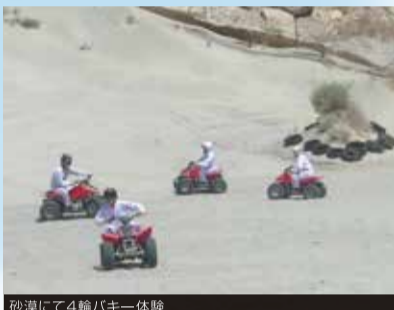
砂漠にて4輪バギー体験