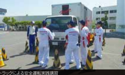
トラックによる安全運転実践講習

5月26日(火)、27日(水)全科1年生を対象に「安全運転講習」を実施しました。この講習には三重県鈴鹿市にある「ホンダ交通安全教育センター」からインストラクター13名にお越しいただき、より実践的な講習を行って頂いています。 1年生にとって入学後、2か月が経過し学園生活にも慣れてきたところですが、その反面で気が緩み、交通事故に巻き込まれる時期でもあります。そこで、交通安全の重要性を自覚と責任ある行動が取れるように、毎年この時期に実施しています。 講習の内容は「交通社会での危険予知の重要性」を中心に学ぶ座学と、トラックやバイク等の実車を使っての「死角の確認」等を学ぶ実技に分かれて、インストラクターの方から具体的にわかりやすく教えて頂きました。これから、二輪でのツーリングに最高のシーズンになりますが、この講習の内容をしっかり意識して安全で楽しいバイクライフを過ごしましょう!