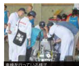
車検を行っている様子

研修の後半はロサンゼルスに移動し、ハリウッド観光、サンタモニカ散策、ディズニーランドなどで楽しんだり、砂漠での4輪バギーを体験しました。また、HPDではレーシングエンジンの開発現場を見学し、貴重な体験をさせていただきました。 学生は今後、大会の振り返りと個々の課題研究を進め、今大会の悔しさをバネに更なるレベルアップを目指します。 ※HPD:ホンダ・パフォーマンス・デバイス・プログラム