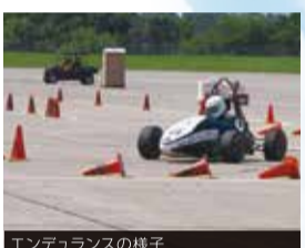
エンデュランスの様子