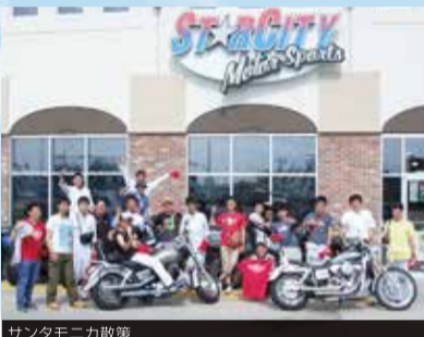
サンタモニカ散策