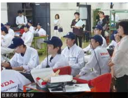
授業の様子を見学