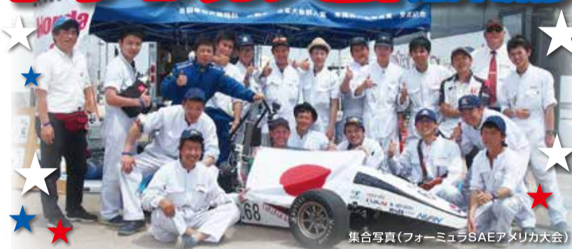
集合写真(フォーミュラSAEアメリカ大会)

6月16日(火)から6月25日(木)までの日程で、自動車研究開発科3年生は、アメリカ海外研修に行きました。 研修の前半は、ネブラスカで行われる「フォーミュラSAEアメリカ大会」に出場しました。アメリカ、カナダの大学を中心に約80チームが参加しましたが、遠くはブラジル、メキシコ、インドからも参加チームがあり、日本からは本校が唯一の出場校です！ 静的審査では、コスト審査で6位に入ったり、プレゼンテーションも昨年の日本大会から大幅に得点を伸ばすことができ、順調に進めることができました。しかし車検において、今回の最大の売りであるアルミフレームで多数の指摘をされたり、ブレーキテストがなかなか合格できなかったため、アクセラレーション(加速競技)・スキッドパッド(旋回競技)に出場することができませんでした。なんと車検に合格、オートクロスコースタイムアタック競技には出場し、しかも本校の過去最高順位を獲得して速さを示すことができたので、なおさら2競技に出場できなかったことは悔やまれました。最終日はエンデュランス・エコノミー(耐久・燃費競技)が行われ、セッティングなど全力を尽くしましたが、ラスト2周でストップして完走を果たすことができませんでした。総合35位という悔しい結果に終わりました。とはいえ、大会終了後は海外チームの学生とも交流を深め合い、貴重な経験をすることができました。