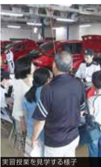
実習授業を見学する様子

6月6日(土)、平成27年度保護者見学会を開催しました。この行事は、1年生の保護者様にとっては、入学後2か月が経過し学園生活にも慣れてきた様子や、また上級生の保護者様には、就職活動状況や国家資格取得に向けての取り組み状況等のご子弟の成長した姿を確認頂く内容となっております。 この日は、学園からの教育の取り組み内容と就職状況の全体説明の後、ご子弟の授業参観、各クラス担当との個別懇談等に追加して頂きました。保護者の皆様にとって、家庭内とは違う、ご子弟の新たな一面も感じ取ってもらう事が出来た1日となりました。