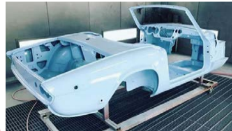
新たに投入される車両「SPITFIRE」。着々とラリー仕様として生まれ変わっています。