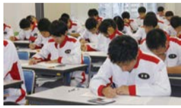
一級自動車整備研究科4年生