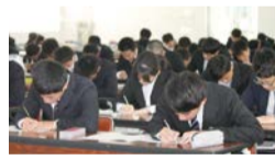
クレバリン適性検査の模擬練習

10月1日、自動車整備科の1年生と一級自動車整備研究科の3年生の就職活動がスタートしました。初めての就職活動に不安や心配なこともたくさんあると思います。夢を叶えるために、職員一同、全力でサポートしていきます!