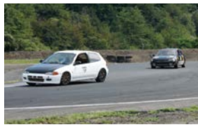
モータースポーツ部

8月26日、日光サーキットでの「日光四輪耐久レース」に参戦しました。燃料セーブのためスロー走行している車両がある中、ホンダ学園は十分な燃料を搭載しており、最後までアクセル全開で見事な追い越しを披露!出場したシビックの中で、堂々の1位を獲得することができました。