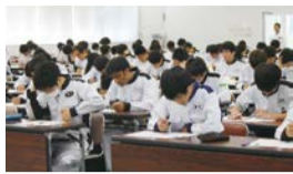
自動車整備科1年生